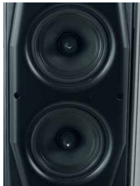
Ecco le meraviglie che si vedono una volta estratta la griglia.